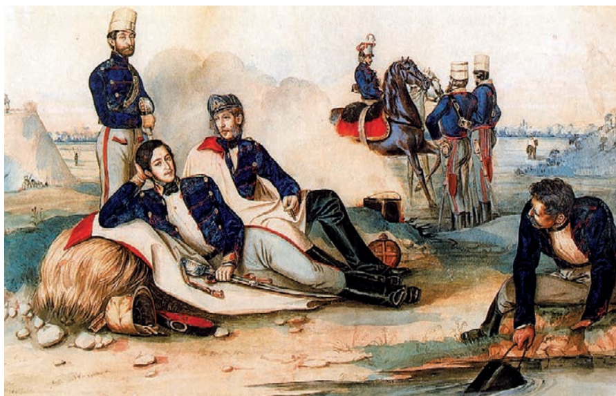
Than Mór: A Károlyi huszárezred tisztjei

loncsolják*: francia eredetű szó (longe), jelentése: a ló futószárral történő körbefuttatása.