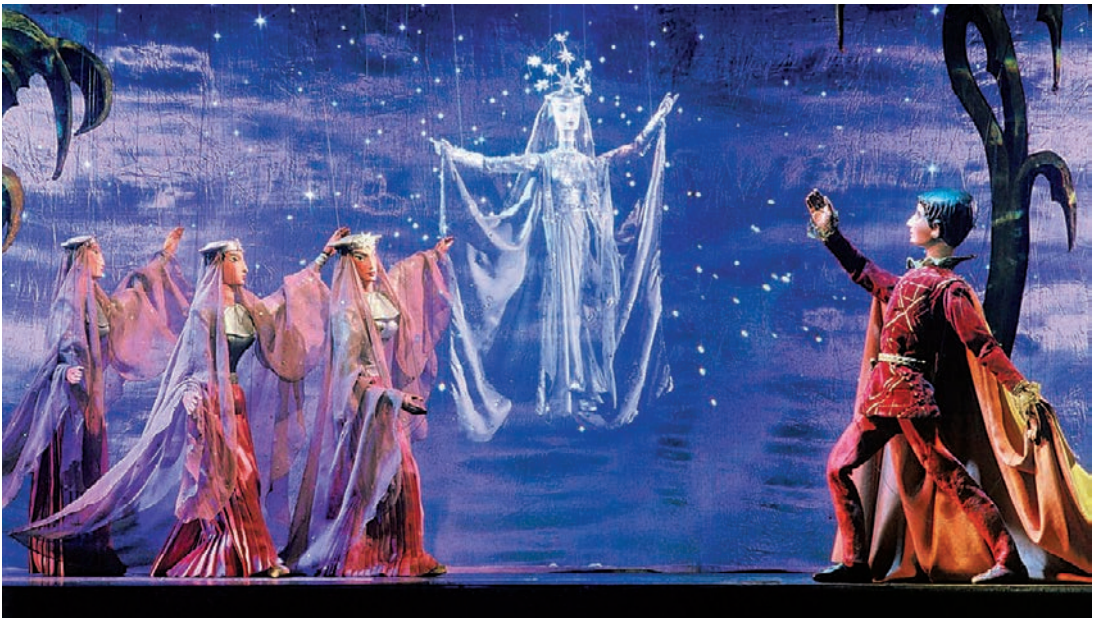
Varázsfuvola – bábéőadás