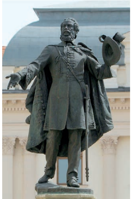
Kossuth szobra a szegedi Klauzál-téren

A dalt Kodály Zoltán dolgozta fel a Hány János című daljátékában.