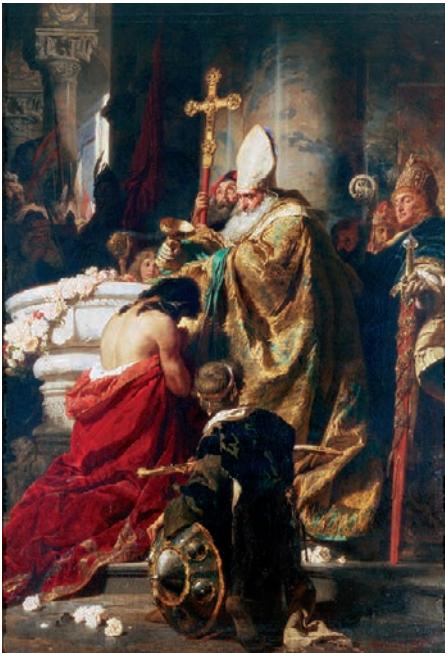
Benczúr Gyula: Vajk megkeresztelése (Magyar Nemzeti Galéria)