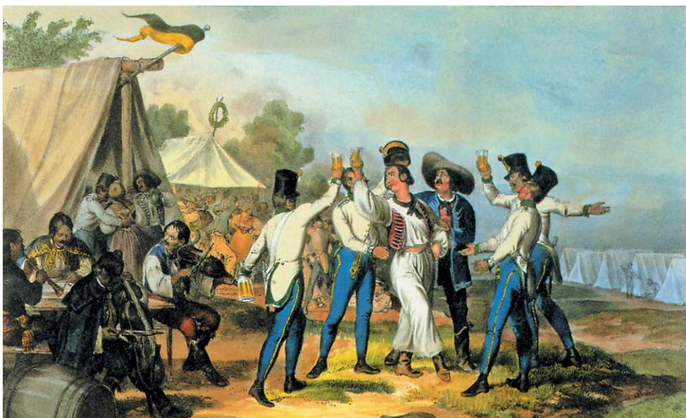
Toborzás, színezett litográfia (Magyar Történelmi Képcsarnok)