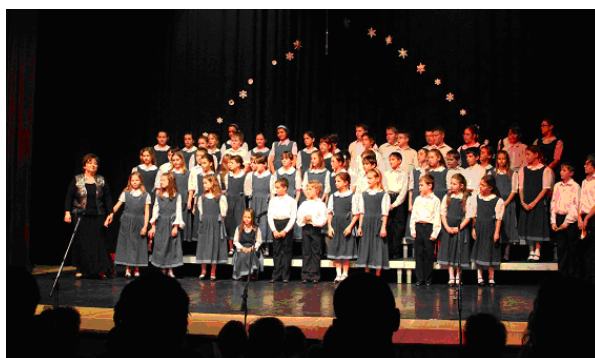
Kaposváron az Éneklő Ifjúság mozgalom keretén belül megrendezett Kicsinyek Kórusa Találkozó n.

Az eredmények közül ki kell emelni, hogy 2011 tavaszán Kaposváron az Éneklő Ifjúság mozgalom keretén belül megrendezett Kicsinyek Kórusa Találkozó n minősítésük: Országos Dicséret Oklevél . 2012 márciusában Budapesten a Magyar Kodály Társaság által kiírt Országos Kamarakórus Verseny népzenei kategóriájában kiemelt dicséretet kaptak. Ez többek között az iskolai néptánc-tanítással szoros egységben történő népzenei kultúra fejlesztésének hivatalos elismerése, amin semmiképpen sem csupán néhány kiemelten tehetséges gyerek sztárolása értendő, hanem valamennyi tanuló személyiségének komplex fejlesztése, művészi képzése, alkalmankénti felkészítésük helyett mindennapi szisztematikus aprómunka. Az idén a főváros után Érden az Országos Kodály Zoltán Kórusverseny en való bemutatkozásuk arany minősítést érdemelt. Felnőttek és gyerekek méltán büszkék rá.