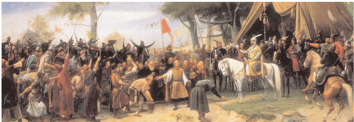
Munkácsy Mihály: Honfoglalás

A magyar nemzeti művészet elismert festője számos fotót és grafikát is felhasznált. Ezért fedezhető fel a képen Jókai Mór is.