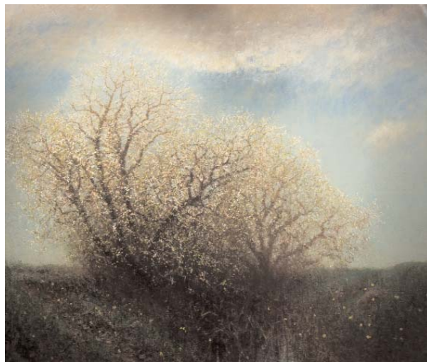
Mednyánszky László: Virágzó mandulafa.

4. A többi festményt is hasonló módon mutatjuk be a tanítványainknak!