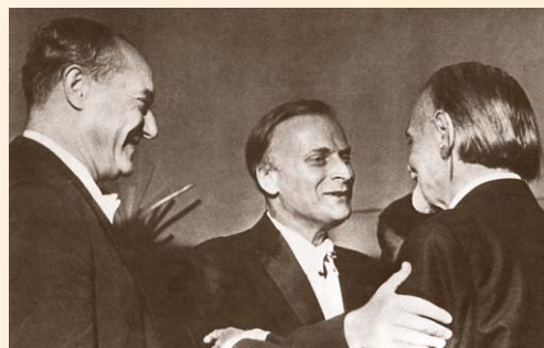
Yehudi Menuhin (középen) Kodály Zoltán és Ferencsik János társaságában