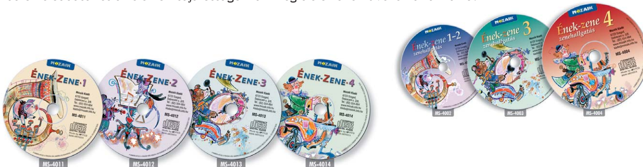
Dalanyag és zenehallgatási anyag

Az ének-zene órákon fontos a didaktikusan felépített zenehallgatási részegység . Helyes irányítással érhető el a hangszín, karakter, tempó és dinamika, szerkezet és szerkesztés felismerése, az esztétikai nevelés megvalósítása, és a zeneművekben való tudatos, élményszerű tájékozódás kialakulása. Ehhez a munkához nyújt segítséget a tankönyvekhez tartozó, hangzó mellékletként megjelenő CD lemezek sorozata, amely az új dalok előadását és az életkori sajátosságoknak megfelelő zeneműveket tartalmazza.